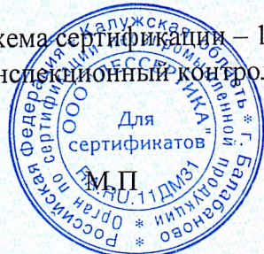
Схема сертификации – 1с(м). Инспекционный контроль – июль 2022 года, июль 2023 года.